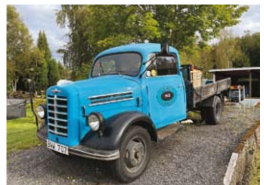
En Borgward B 1500 från 1953 är numera mycket ovanlig, den här hittade Görän utanför Jönköping.