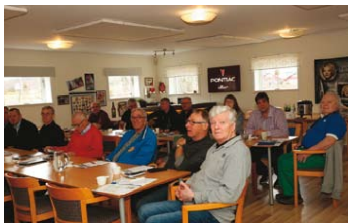
Intresserade deltagare från de deltagande klubbarna.