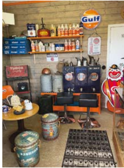
Oljebaren fanns för många år sedan på en mack i Flisby och sedan dess har det tillkommit en hel del "macksaker" som synes.