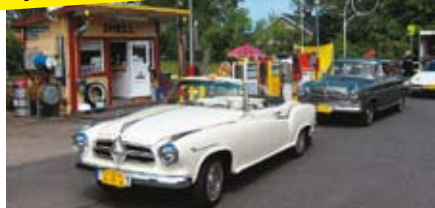
Två ovanliga Borgward Isabellor framför den trevliga macken.