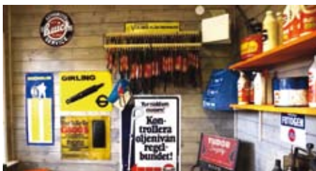
Ett sortiment fläktremmar var standardvara på mackarna förr.

och där blev den stående till 1998. Jag fick för mig att det skulle vara roligt att få ut den på vägarna igen så jag be-