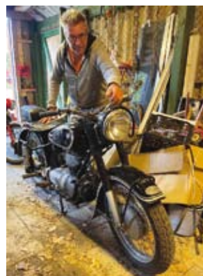
BMW R 25-2 250 cc, givetvis från 1953, startade på ett kick.