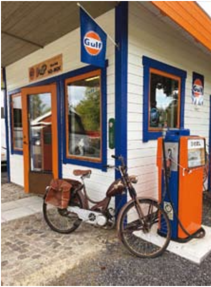
Monarken från -53 står parkerad vid gaveln på macken. Notera de tidsenliga packväskorna, så här kunde en bruksmoppe se ut när det begav sig.