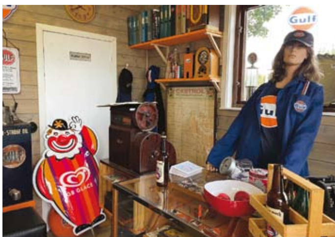
Givetvis finns en Gulfskyldocka bakom disken, tillsammans med en mängd mindre saker som kunde finnas på en mack blir intrycket komplett.

– Det finns inte många kvar numera, jag känner till tre och kanske finns det ett par till i landet. Den är perfekt att köra hem saker med när sambon har varit på loppis och handlat.