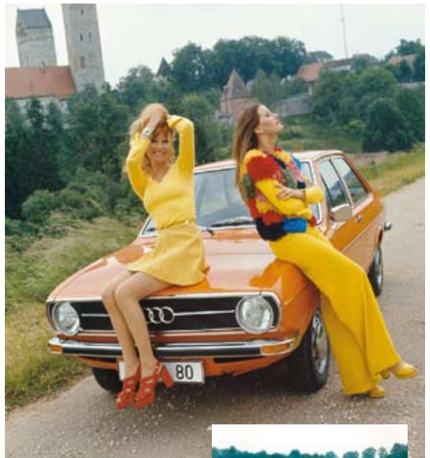
Audi 80 och systemmodellen Volkswagen Passat var färgglada inslag i trafikbilden. Båda modellerna blev storsäljare.

Man hade strävat efter att bygga bilarna så lätta som möjligt. Följden blev att Audi använde sig av tunnare plåt i karossen vilket straffade sig i längden.