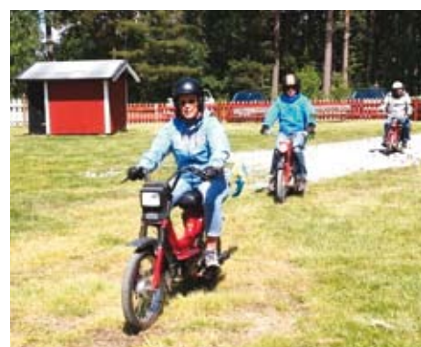
Tre mopedister på väg in till slutmålet.

Det var en brokig blandning av modeller och årsmodeller ställda upp i årets utflykt.