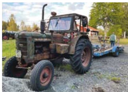
Trots sitt något slitna utseende fungerar den gröna BM 35:an utmärkt och får göra tjänst som vardagstraktor, bra att ha till det mesta.