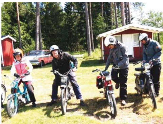
Glada deltagare efter målgången vid Gisshults badet.