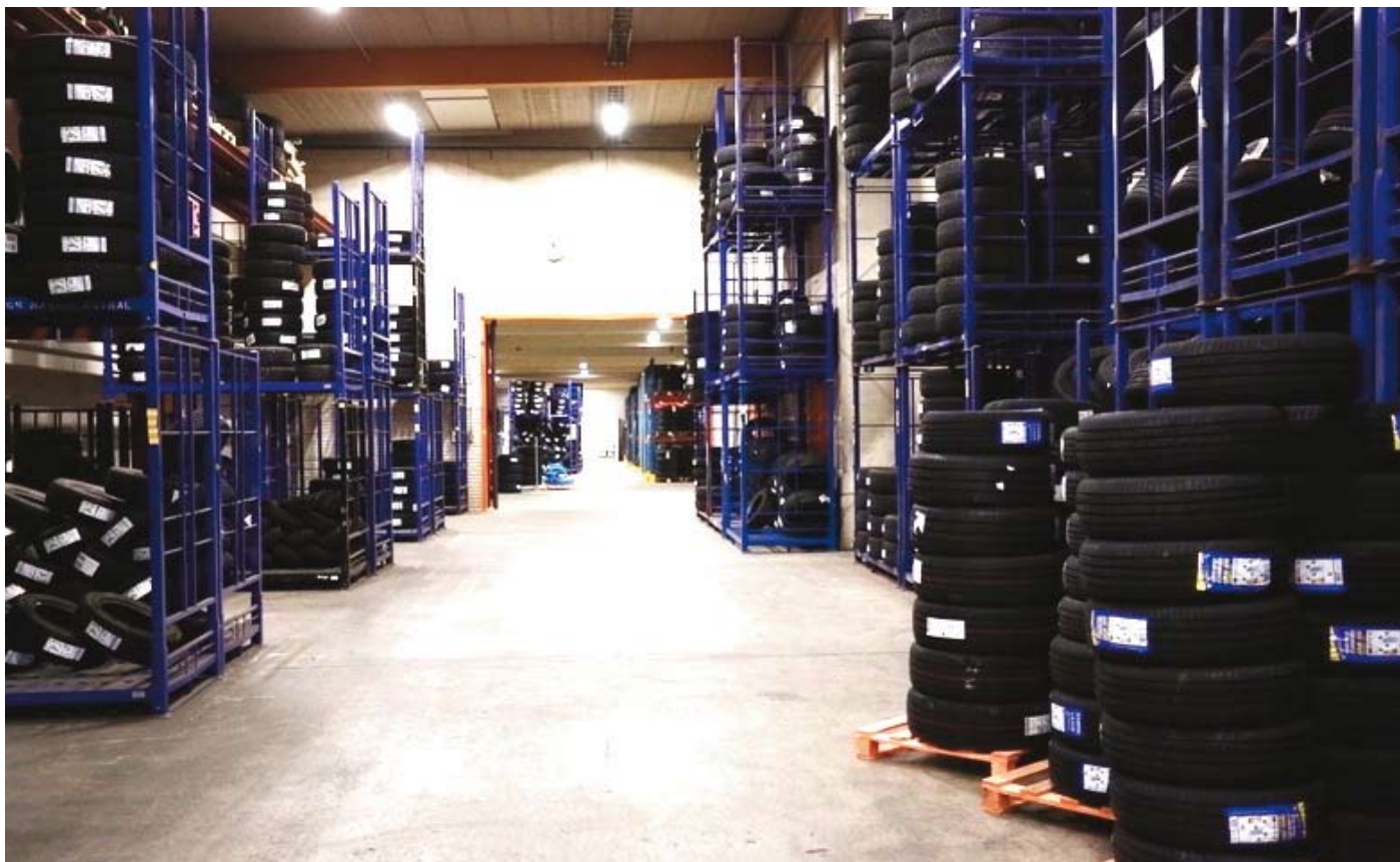
Ängs Däckverkstad har ett stort lager. En stor del av de nya däcken förvaras på höga lagerhyllor.