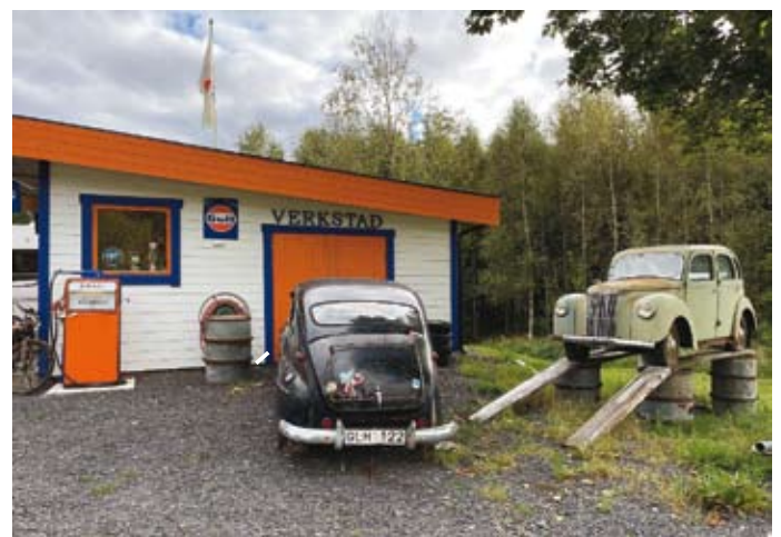
Vid gaveln står Volvo PV 444 och en Ford Prefect parkerade. Här handlar det om årsmodellerna 1952 och 1954, det får trots allt godkänt eftersom årtalen gränsar till 1953.