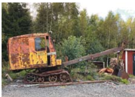
Vad ska man ha en lingrövade till? Ja, till exempel för att gräva upp ett hål och fylla igen det igen. En Åkerman från 1953 är rätt maskin för uppgiften.