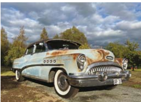
Buick Roadmaster var en riktig lyxbil när det begav sig, den här patinerade -53:an har Görän använt flitigt under flera år.