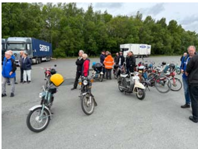
Moppar anländer till startplattan

Tack till "Kalle moped" och co som gjort den fina rundan.