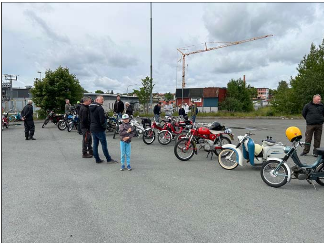
Uppladdning inför starten från Gjuterigatan 7 Nässjö