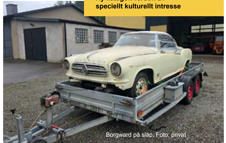
Borgward på släp.

Parlamentets förslag skiljer sig, till fordonsägarnas fördel, från kommissionens och rådets förslag. Parlamentets position kommer fastställas tidigast den 8 september. Därefter kan den nya ELV-förordningen antas om parlamentet och rådet kan enas om de ändringar de var för sig föreslagit. Rådet antog sin allmänna riktlinje den 11 juni 2025. Därför är det viktigt att regeringen står upp för förslaget. Följ senaste nytt på mhrf.se/elv och MHRFs sociala medier.