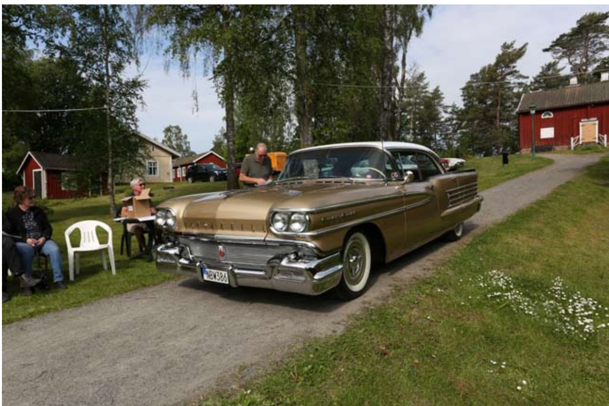
Sylve Järgfelt anländer med en Oldsmobile Dynamic 88 1958