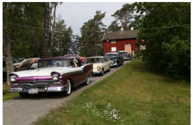
Kö till målgång