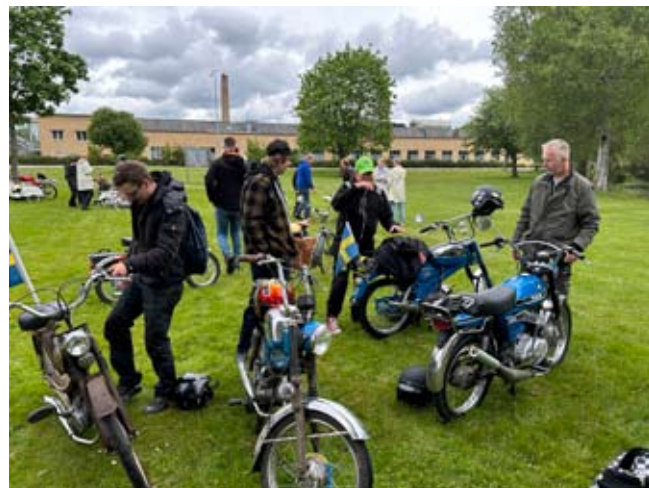
Delmål i Anneberg