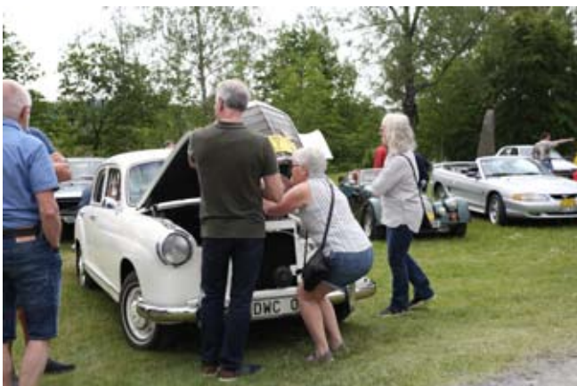
Mercedes Benz 219 1958