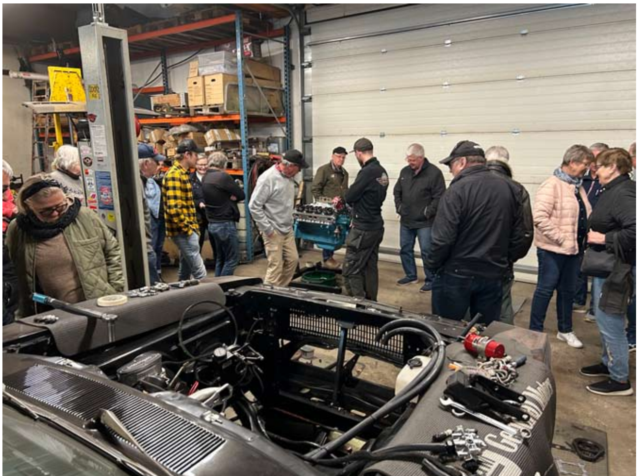
Besökarna tar del av projekt i verkstaden