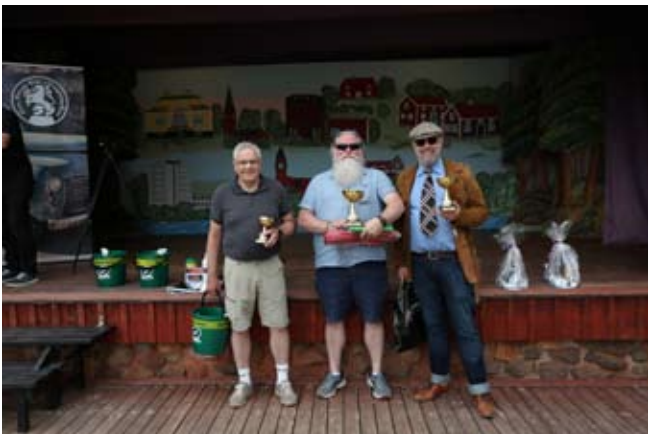
Första, andra och tredje pristagarna