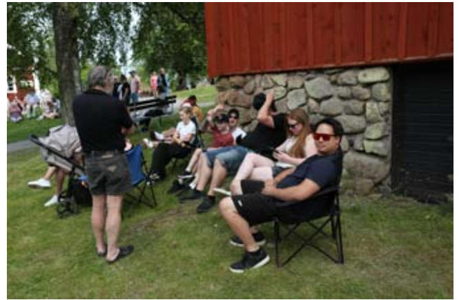
Rally-åskådare på första parkett