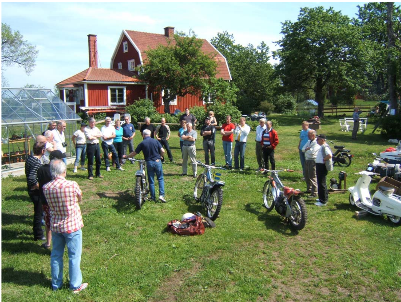
Från Mopedträffen Kansjön runt